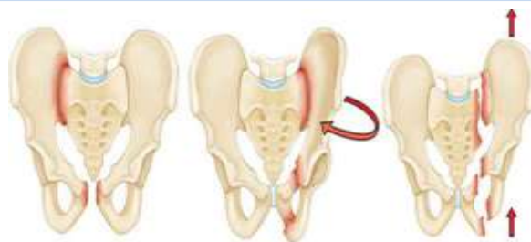
شکستگی با فشار از عقب و جلو